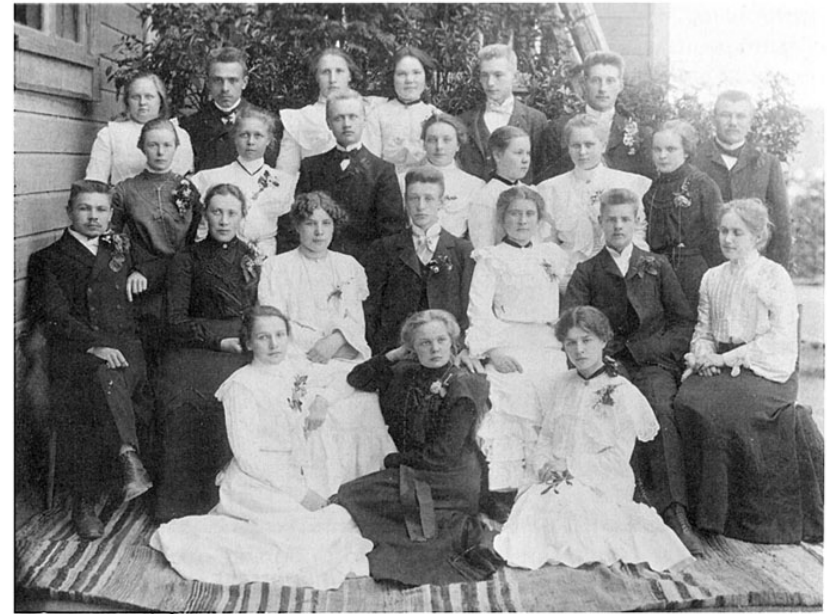
Ensimmäinen viides luokka vuonna 1904.