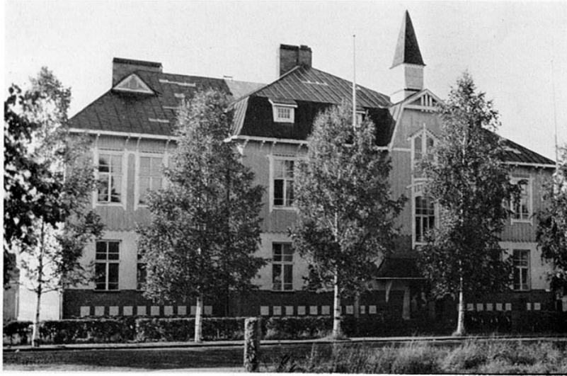
Uusi koulutalo lisärakennuksineen.

Ensimmäisissä ylioppilaskirjoituksissaan seuraavana keväänä VIII luokan oppilaat menestyivät varsin hyvin: 11 kirjoittajasta hyväksyttiin 9. Lukuvuoden päättäjäsissä, jotka samalla olivat koulun kymmenvuotisjuhlat, todettiin: