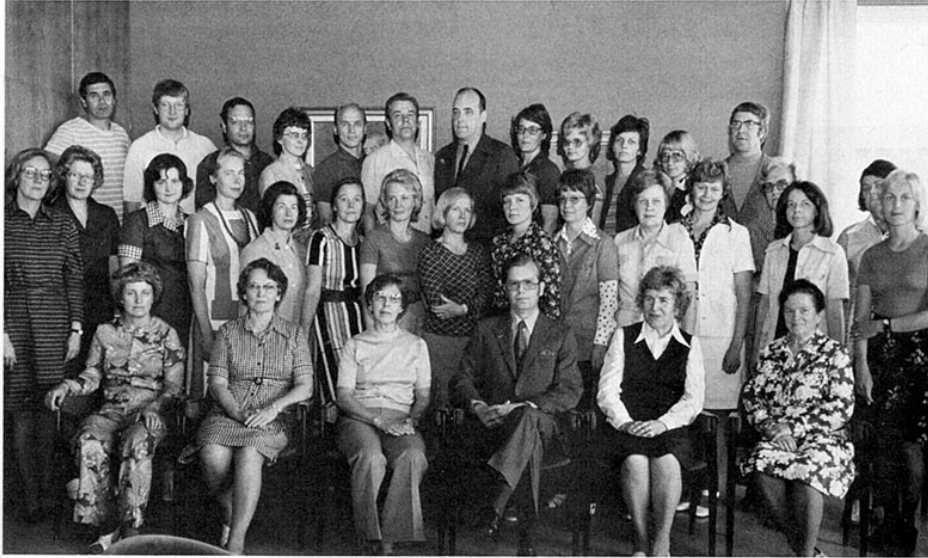
Opettajisto vuonna 1974