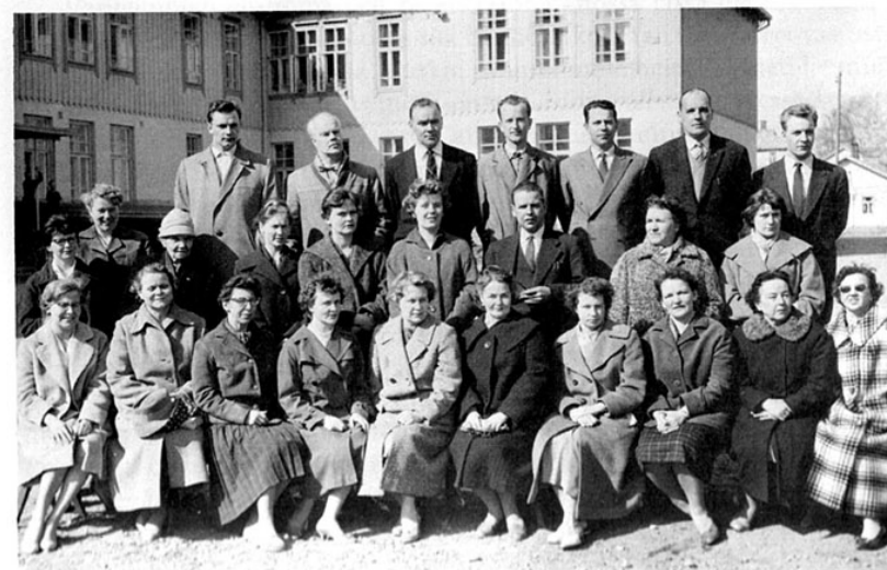
Opettajisto vuonna 1959