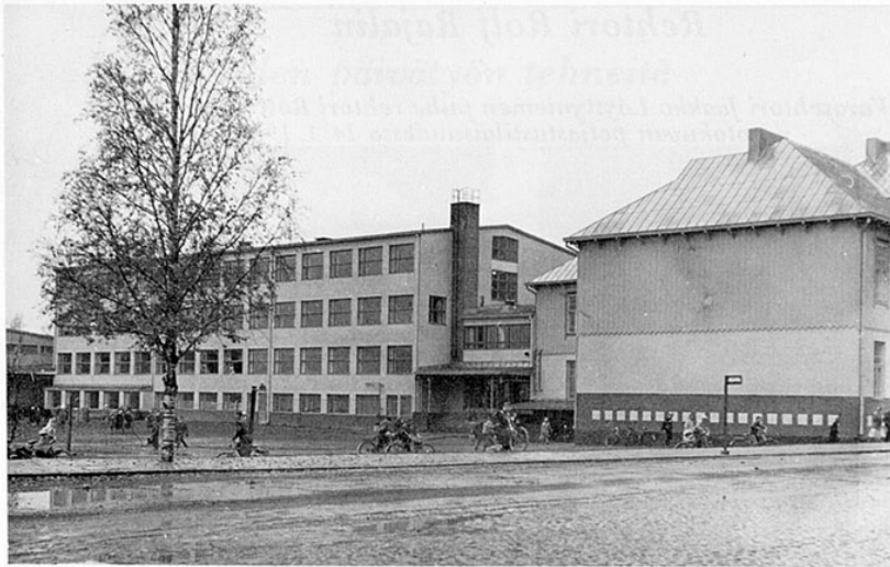
Forssan yhteislyseo vuonna 1974.

taan kuuluneet tehtävät ovat lisääntyneet oppilasmäärien kasvaessa, opetuksen monipuolistuessa ja kouluhallinnon kehittyessä. Esimerkkinä voidaan todeta, että ylioppilaskirjoituksiin osallistuneiden määrä on kymmenessä vuodessa kolminkertaistunut. Ylioppilaskirjoitusten muuttuessa ja monipuolistuessa ovat kouluun lähetetyt kirjelmät viime vuosina moninkertaistuneet. Esimerkiksi vuonna 1961 ylioppilastutkintoon liittyviä kirjelmiä tuli koululle 12 kappaletta, mutta kymmenen vuotta myöhemmin niitä tuli jo 61.