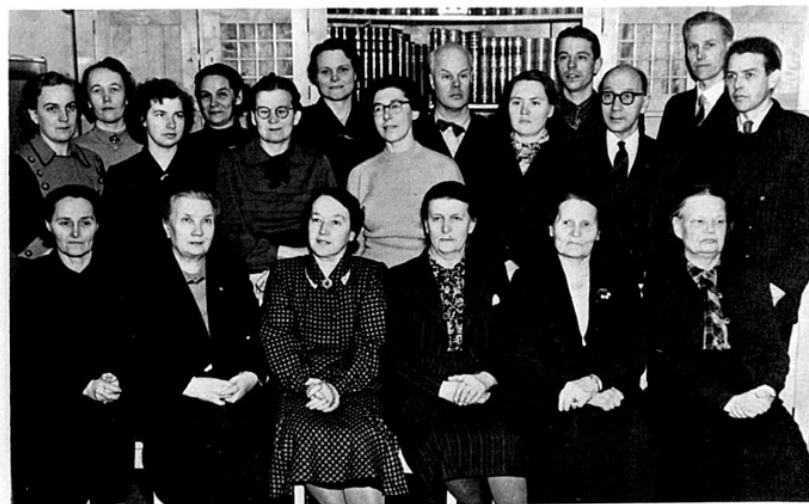
Opettajisto vuonna 1951