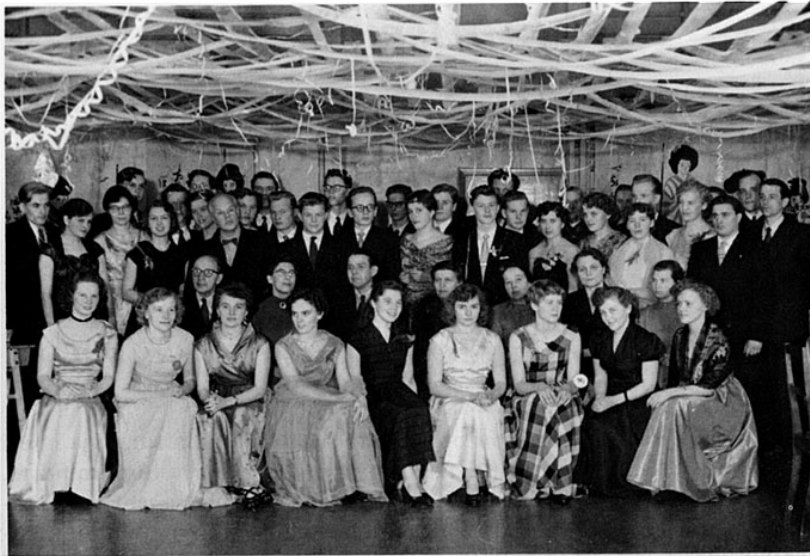
Penkinpainajaisien loistoa vanhassa juhlasalissa.

Omana erikoisjuhlanään on mainittava abiturienttien penkinpajaiset, jotka vielä 50-luvun alkupuolella vietettiin koulussa. Kuukausia ennen varsinaisen koulunkäyntinsä päättymistä olivat abit pitäneet kokouksiään ja työiltojaan, joiden tuloksena koulun juhlasali sai koristuksen, jonka luomisessa oli käytetty runsaasti mielikuvitusta ja paljon työtä. Jännittynyt odotus vallitsi koko koulussa, kun juhlasalin ovi avattiin aamuhartauden ajaksi ja pääsimme näkemään abien aikaansaannoksen. Opettajat oli kutsuttu penkinpajaisiltana mukaan juhliin, mutta puolen yön maissa läksimme — huomispäivän töitä syyttäen — pois ”joutuin vain nyt nukkumaan luo” -laulun saattelemina. Penkinpajaiset muodostuivat täysin ymmärrettävästi tässä muodossa oppilaille melkoiseksi rasitukseksi, joten tava luovuttiin.