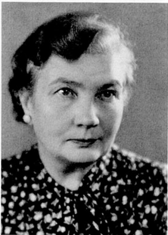
Miili Simpura piirustus