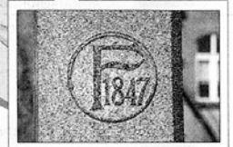
Puuvillatehtaan portin kivipylväät: 150 vuotta Wahreninkadun päässä.